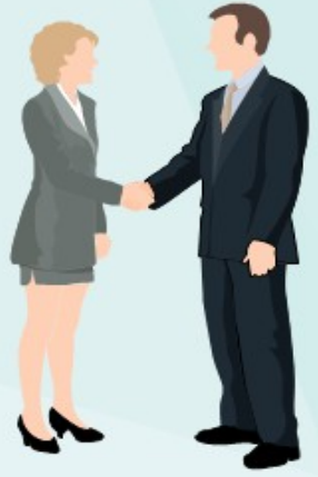
Všeobecná konference služeb